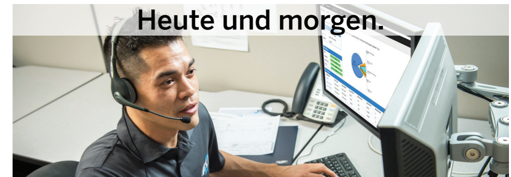
Heute und morgen.

Mit dem Einsatz von Projektmanagement-Praktiken, Risikominderungstechniken und Produkt- und Prozessentwicklung stellen wir sicher, dass Sie Ihre geschäftlichen Ziele erreichen.