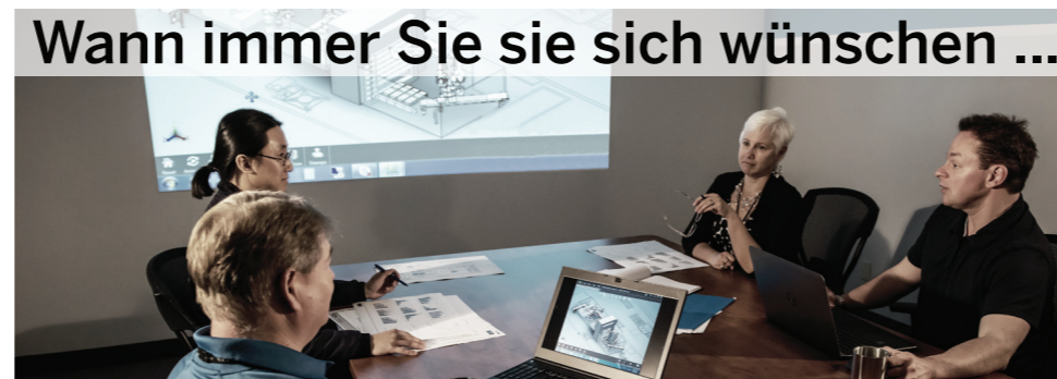
Wann immer Sie sie sich wünschen ...

Dynamische Diskussionen, kontrollierte Prozesse, ausgewählte Lieferanten und Partner sowie hoch qualifizierte Mitarbeiter schaffen Automatisierungslösungen, die Ihren Anforderungen entsprechen – sowohl denen Ihrer wichtigsten Interessengruppen als auch den regulatorischen und CGMP-Anforderungen.