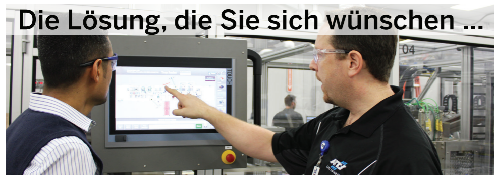
Die Lösung, die Sie sich wünschen ...

Dynamische Diskussionen, kontrollierte Prozesse, ausgewählte Lieferanten und Partner sowie hoch qualifizierte Mitarbeiter schaffen Automatisierungslösungen, die Ihren Anforderungen entsprechen – sowohl denen Ihrer wichtigsten Interessengruppen als auch den regulatorischen und CGMP-Anforderungen.